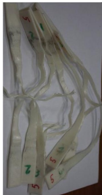
Фотографии элементарных образцов REC FLEX после испытаний